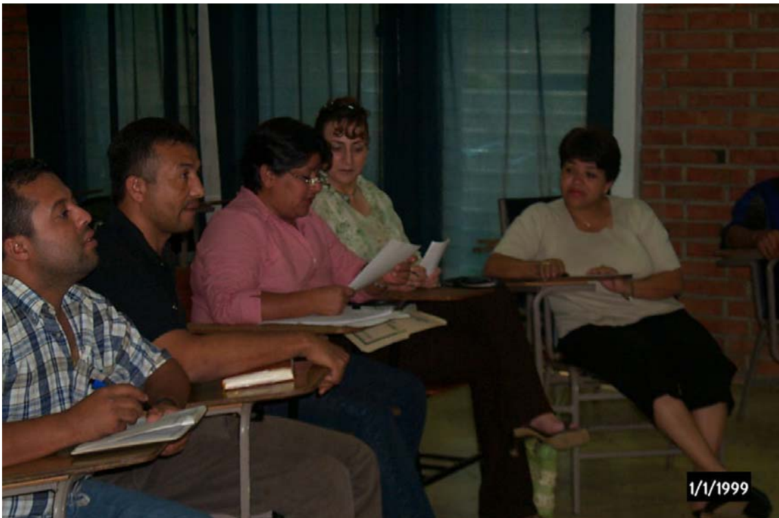
Maestros y miembros de la sociedad civil integrados al proceso de capacitación.