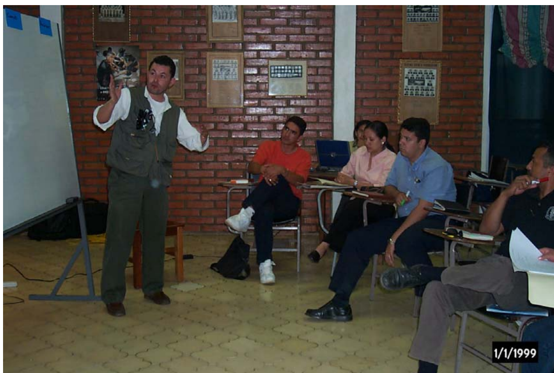
Planificación del festival de la leche y de la actividad de capacitación en los municipios de Santa María del Real y Catacamas, con la Sociedad Cultural de Catacamas.