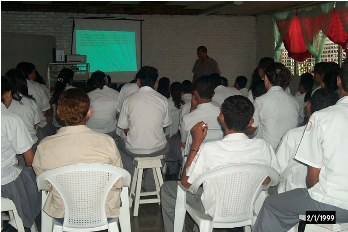
Capacitación a estudiantes del Instituto La Fraternidad, Juticalpa.