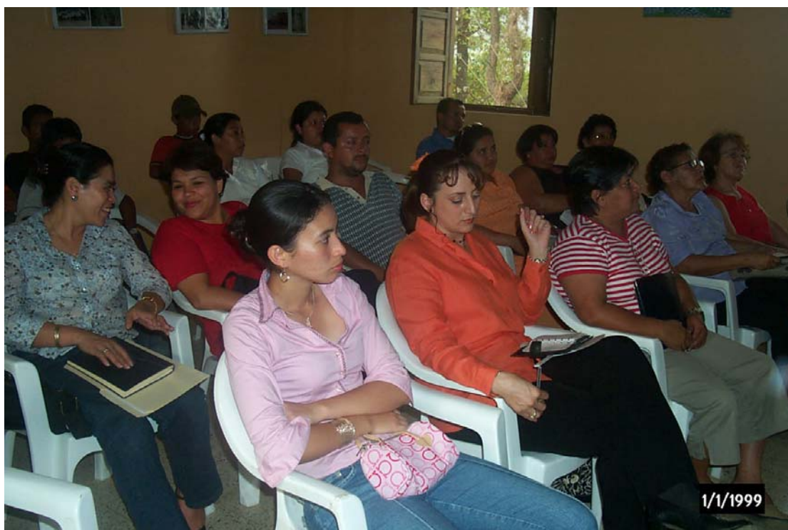
Reunión de capacitación, educadores, sociedad cultural, 14 de enero 2205.